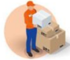
POSTAL OPERATORS INSIDE AND OUTSIDE THE EU