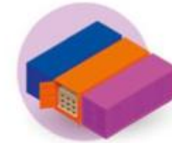
SEA, RAIL AND ROAD TRANSPORT