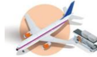
AIR CARGO CARRIERS