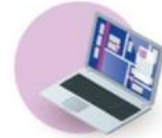
FREIGHT FORWARDING AND LOGISTICS COMPANIES